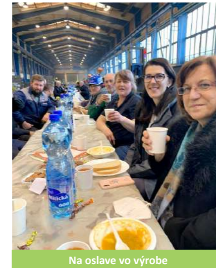
Na oslave vo výrobe

časom stali priatelia. Počas svojej kariéry som stretla a spolupracovala naozaj s mnohými ľuďmi, takže ten kontakt s kolegami, na ktorý som bola dennodenne zvyknutá mi bude najviac chýbať. Považujem sa za Vagonárku už odjakživa, pretože tým, že tu pracoval otec aj strýko, bola som zvyknutá na túto firmu, dá sa povedať, že od kolísky. Od mala som vnímala aj noviny, boli pre mňa zaujímavé, preto som sa rozhodla nastúpiť do Tatravagónky ako druhá generácia našej rodiny v tejto firme.“