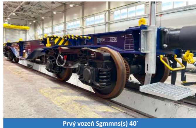
Prvý vozeň Sgmmns(s) 40'

umožňuje prepravu materiálu a za určitých podmienok prepravu personálu na stavenisko.