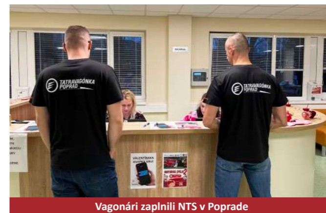
Vagonári zaplnili NTS v Poprade