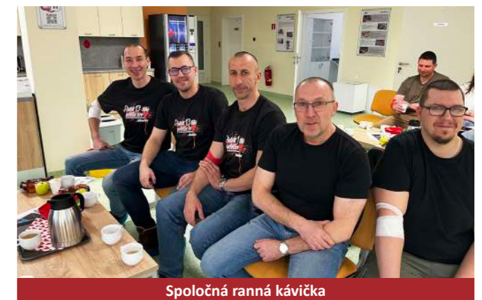
Spoločná ranná kávička