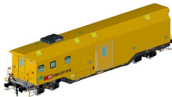
Vozeň Uas s nadstavbou