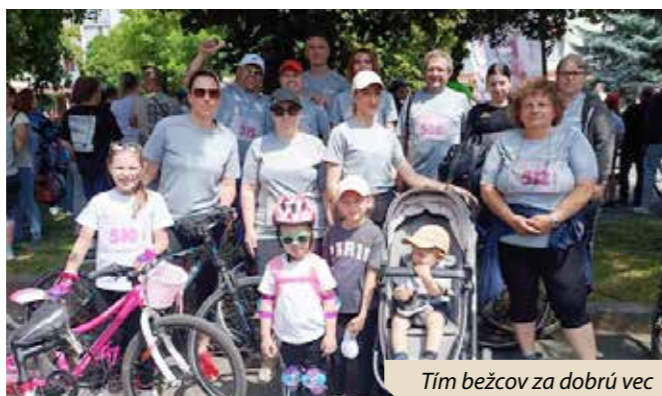
Tím bežcov za dobrú vec

ona a jej najbližší, ale aj celý náš kolektív. Sme hrdí a veľmi sa tešíme, že takto zviditeľnila našu spoločnosť, za čo jej ďakujeme a k úspechu blahoželáme. Dúfame, že do budúcnosti bude inšpiráciou aj pre nás ostatných.