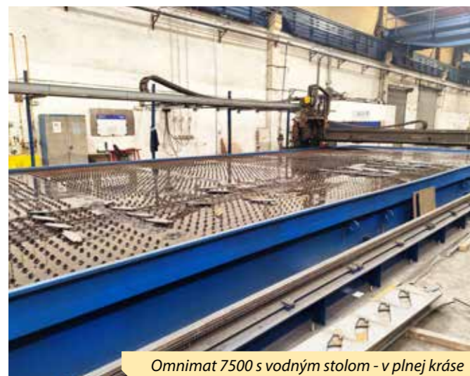
Omnimat 7500 s vodným stolom - v plnej kráse

na ktoré sa budú ukladať tabule plechov. Tieto stoly sú naplnené vodou. Vo vagonárskom termíne ich nazývame vodné stoly. Vodná hladina je iba cca 1 cm pod povrchom tabu-