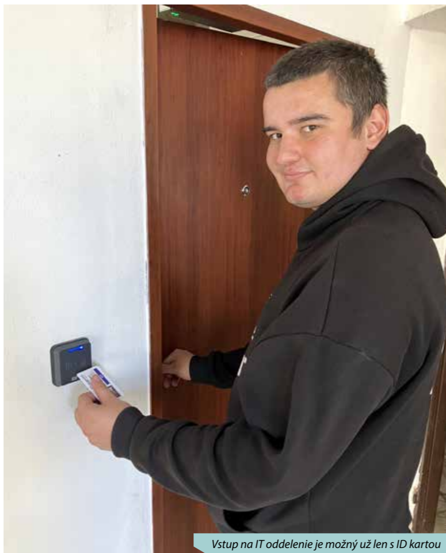
Vstup na IT oddelenie je možný už len s ID kartou

Fyzická bezpečnosť je preto neoddeliteľnou súčasťou komplexného prístupu k ochrane kybernetických systémov. Kombinácia fyzických