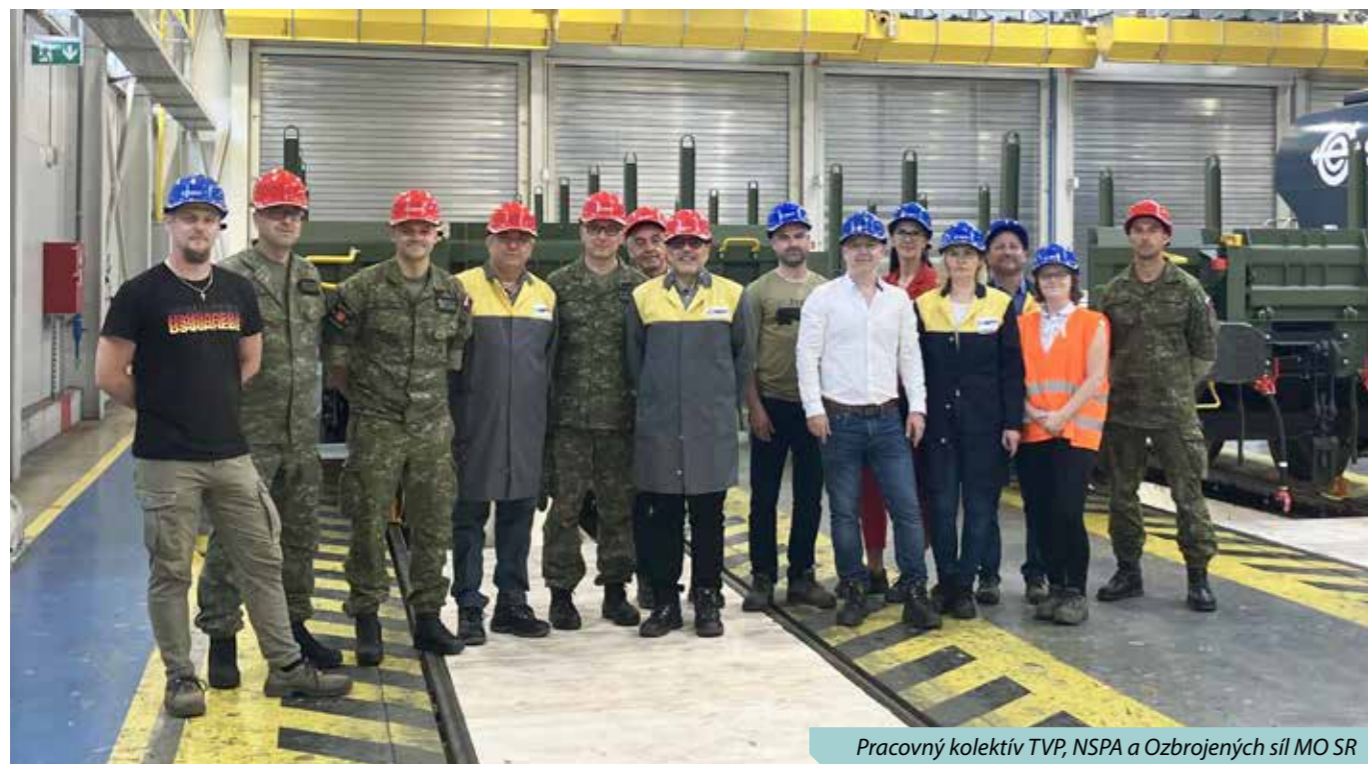
Pracovný kolektív TVP, NSPA a Ozbrojených síl MO SR

ciu za dôkaz, že slovenský priemysel je na špičkovej úrovni. „Tatravagónka je európsky líder vo výrobe nákladných železničných vozňov a dnes sa to iba potvrdilo,“ povedal minis-