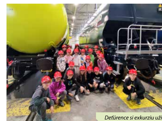
Detúrence si exkurziu užili

Celkom 50 maličkých Drobčiekov v sprievode pani učiteľiek nacupitalo bránou do Vzdelávacieho centra, v ktorom sme im predstavili portfólio spoločnosti, výrobu a výrobky. Po teoretickej časti nasledovala prehliadka areálu. Detúrence sa pekne rozdelili do dvoch skupín, zoradili sa a vyrazili vpred neznámemu. Mal som tú česť byť sprievodcom jednej skupiny a veľmi sa mi páčilo, akí boli Drobčiekovia disciplinovaní. Prehliadku sme začali v hale výroby podvozkov. Ukázali sme im prácu zváračov a zváracích robotov. Potom sme sa presunuli do haly s rezacími strojmi a vysvet-