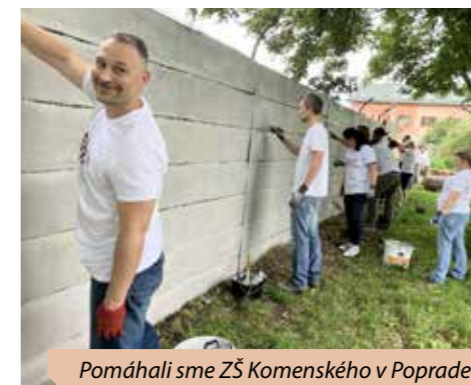
Pomáhali sme ZŠ Komenského v Poprade