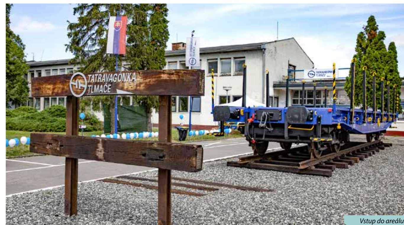
Vstup do areálu