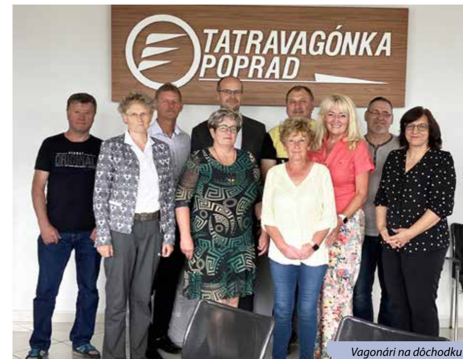
Vagonári na dôchodku