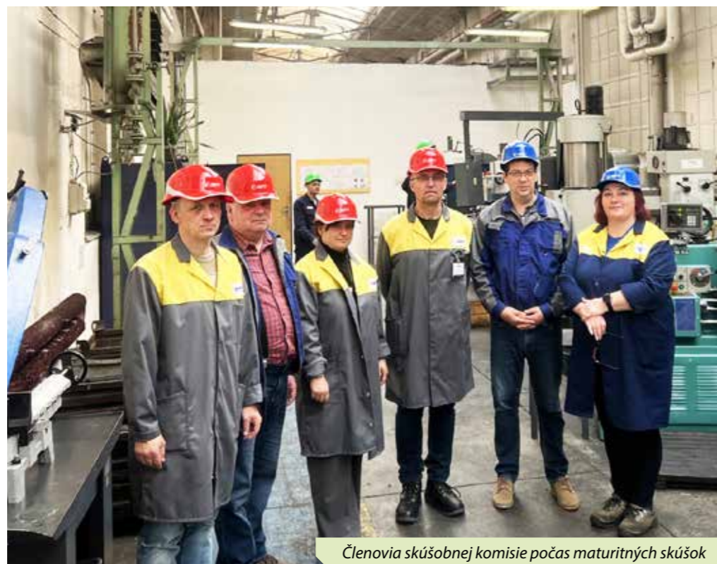
Členovia skúšobnej komisie počas maturitných skúšok

V tomto školskom roku úspešne ukončilo vzdelávanie v Poprade maturitnou skúškou 12 študentov a 1 končil záverečnou skúškou. Hneď po ukončení školy začali naši noví absolventi pracovať: dvaja na pozícii frézar CNC na BU01, dvaja ako pomocní paliči na BU01, dvaja na BU06 ako zvárači, traja nastupujú ako prevádzkoví elektrikári, dvaja sa rozhodli pre vysokú školu a dvom študentom sme umožnili pre dochádzanie pracovať v Zastrova a.s., prevádzkareň Orlov. V závode v Trebišove ukončilo štúdium od