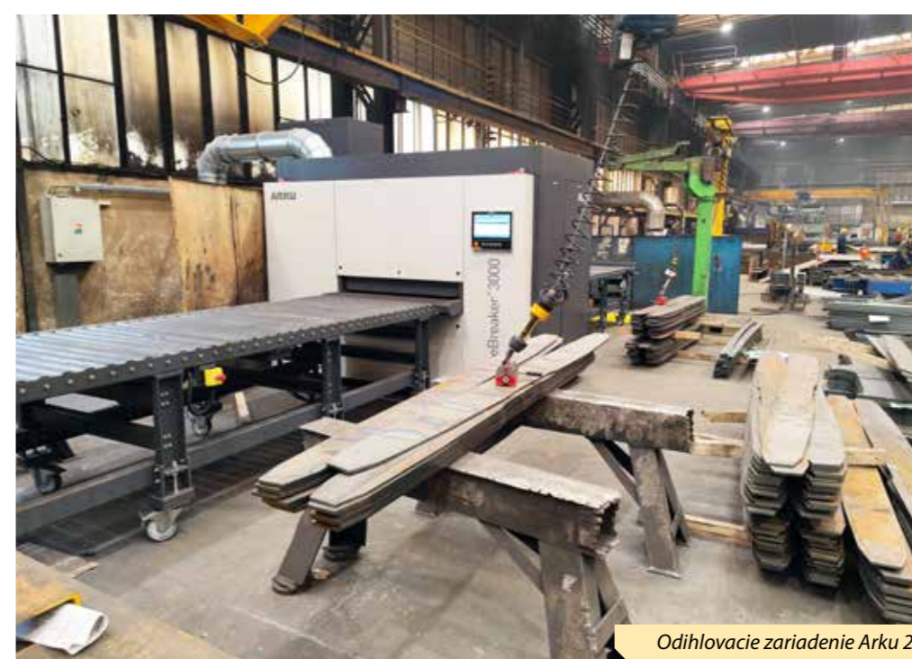
Odihlovacie zariadenie Arku 2

vať, preto budú vodné stoly okrem vody naplnené aj prísadami, ktoré spomalia proces hrdzavenia dielcov.