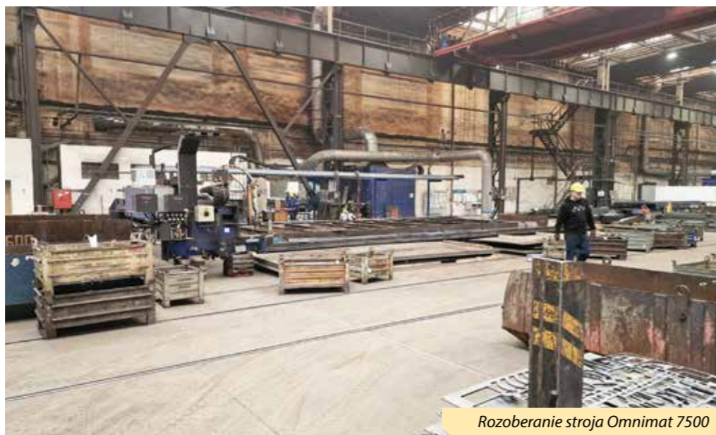
Rozoberanie stroja Omnimat 7500

jednotlivé fázy prebiehať. Začneme prvou etapou.