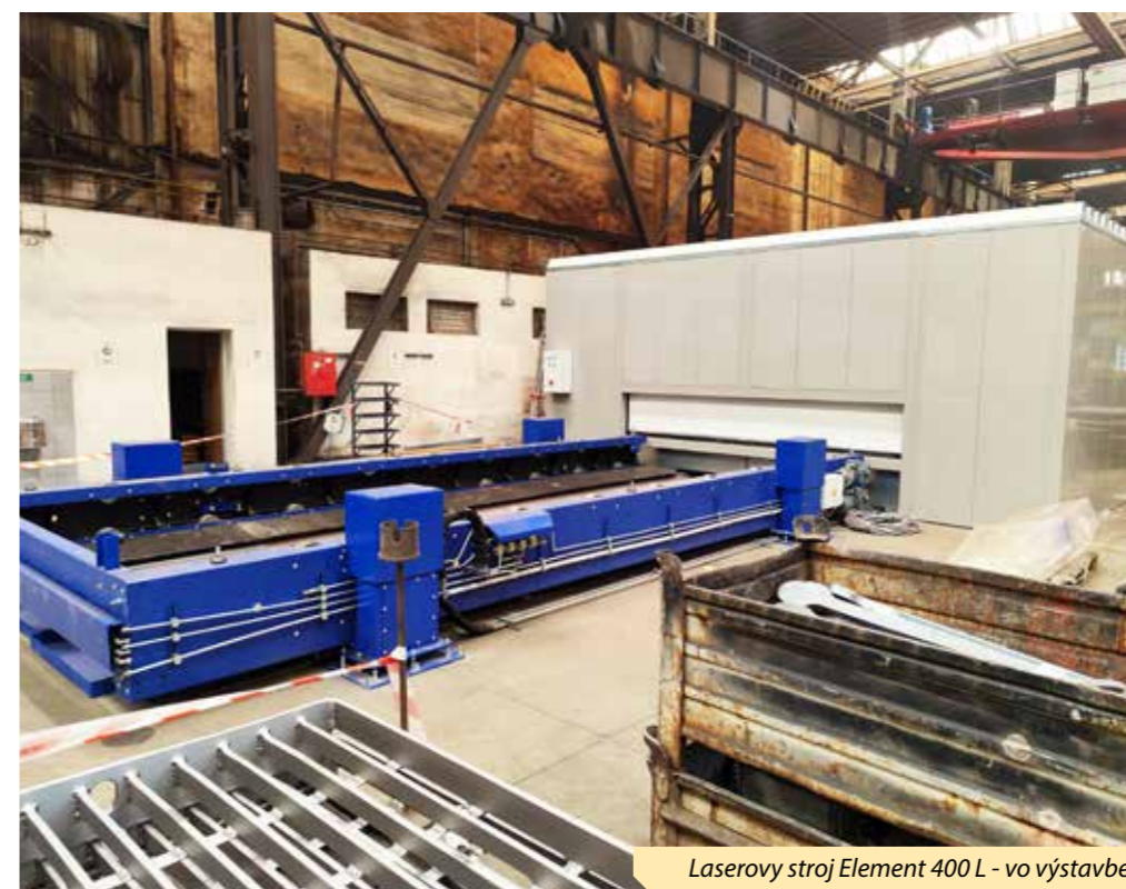
Laserový stroj Element 400 L - vo výstavbe