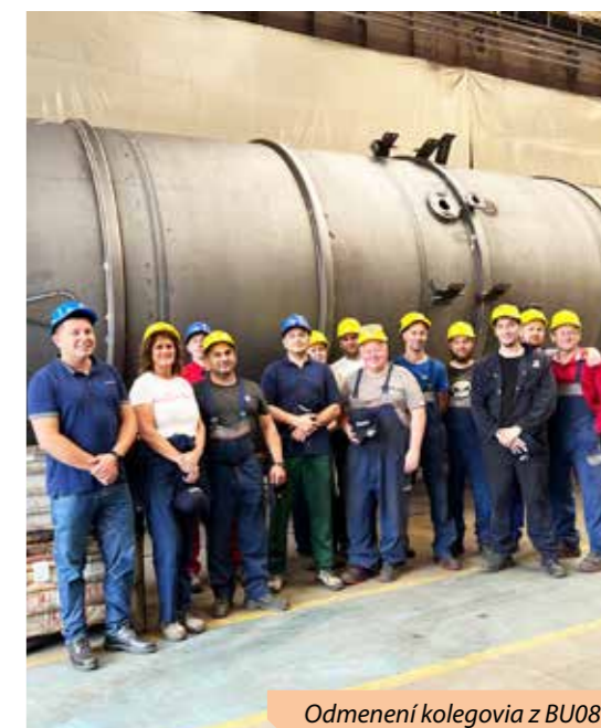
Odmenení kolegovia z BU08