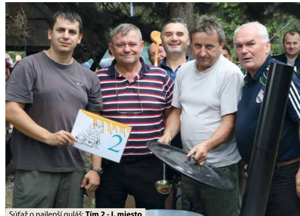
Súťaž o najlepšie guláš: Tím 2 - 1. miesto

čo určite motivovalo všetkých účastníkov turnaja podať svoje najlepšie výkony. Predstavte si, že o pár rokov budete ukazovať kolegom svoje meno vyryté navždy na pohári. To stojí za trochu potu na kurte.