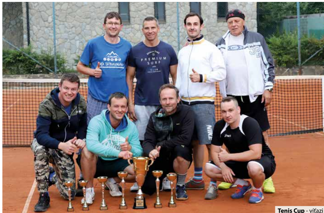
Tenis Cup - víťazi

za rok. V tomto roku pribudlo niekoľko novínek. Tímy umiestnené na prvých troch miestach doteraz získavali jeden pohár. Tentoraz pribudli poháre dva, pre každého hráča tímu. Takisto pribudol putovný pohár, ktorý získal víťazný tím. Novinkou je gravírovanie mien na putovný pohár,